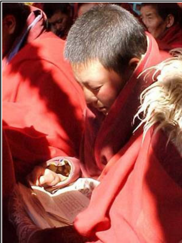
Nonnen rezitieren heilige Schriften in Larung Gar

In öffentlichen Verlautbarungen rechtfertigen die Behörden der VRC ihre Aktionen lediglich als Mittel, um die übergroße Zahl von Studenten zu reduzieren. In vertraulichen Dokumenten wird das Serthar Institut hingegen beschuldigt, mit der "Dalai Clique" zu sympathisieren, antichinesische Elemente zu beherbergen und nicht den „offiziellen Standpunkt“ zu vertreten. Die Anwesenheit zahlreicher internationaler Studenten in Serthar wurde als eine potentielle Bedrohung der "Stabilität" der Nation angesehen. Das offizielle Mißtrauen der Religion gegenüber wurde von Hu Jintao, dem Vizepräsidenten der VRC, im März 2001 ausgesprochen, als er sagte, daß "illegalen Aktivitäten unter dem Deckmantel der Religion energisch Einhalt geboten werden muß...". Hu, der designierte Nachfolger von Jiang Zemin, ist ein streng linientreuer Funktionär; von 1988 bis 1992 war der Sekretär der KP in der Autonomen Region Tibet.