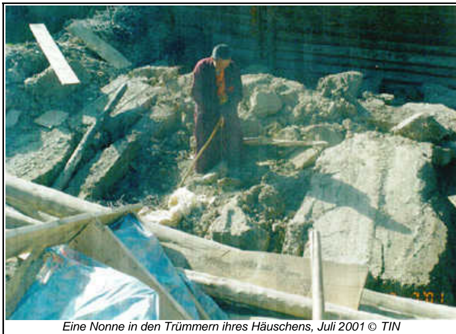
Eine Nonne in den Trümmern ihres Häuschens, Juli 2001

zurückzuschicken. Die Bewohner wurden dann während einer Massenzusammenkunft nach ihren Namen und anderen persönlichen Einzelheiten gefragt, und wieder wurden die im Institut permanent Ansässigen gezählt.