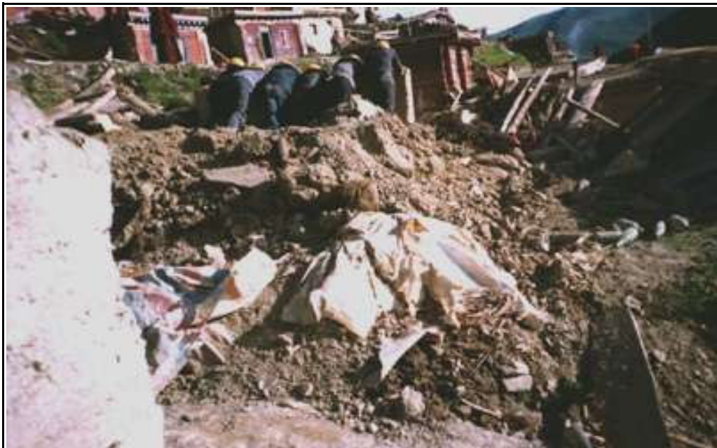
Chinesische Arbeiter beim Abriß von Häusern in Larung Gar im August 2001

Die UN-Kommission für Menschenrechte hat „angemessene Wohnung“ so definiert, daß sie das Recht auf Schutz vor gewaltsamer Vertreibung einschließt. "Gewaltsame Vertreibung" zieht "die permanente oder vorübergehende Entfernung von Individuen, Familien und/oder Gemeinschaften gegen ihren Willen aus ihren Wohnungen und/oder dem Grund und Boden, auf dem sie leben, nach sich, ohne daß sie Zugriff auf angemessene