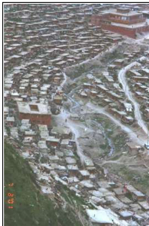
Ansicht des Serthar Instituts in der ersten Augustwoche 2001

Im Juni 2001 wurde das siebenköpfige ständige Komitee des Instituts wiederholt aufgefordert, Schriftstücke, die den Abriß rechtfertigen würden, zu verfassen und zu verbreiten. Chinesische Beamte verlangten von den Komiteemitgliedern, darin zu schreiben, daß die Zerstörung der Lehranstalt auf Anordnung des Instituts selbst erfolge. Sie wurden auch angewiesen, zwei Hütten eigenhändig zu zerstören. Die Mitglieder des Komitees weigerten sich, diesen Forderungen Folge zu leisten und erwiderten, daß ein derartiges Ansinnen ihren religiösen und gesellschaftlichen Überzeugungen zuwiderliefe.