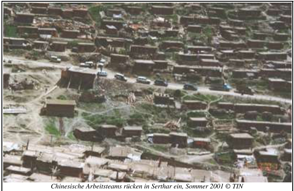
Chinesische Arbeitsteams rücken in Serthar ein, Sommer 2001

Im Spätherbst 2001 tauchten widersprüchliche Gerüchte über den aktuellen Aufenthaltsort und den körperlichen Zustand von Khenpo Jigme Phuntsok, den