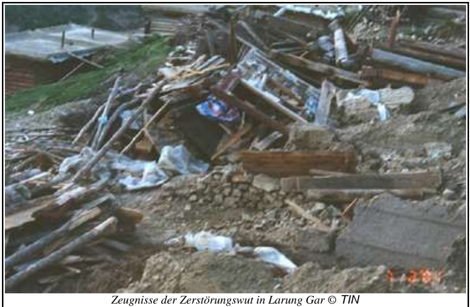
Zeugnisse der Zerstörungswut in Larung Gar

Die Beamten riefen uns zu sich, baten uns eindringlich und redeten uns gut zu, daß wir zu unseren jeweiligen Ursprungsorten zurückkehren sollten. Dann drohte man uns mit entsetzlichen Konsequenzen, falls wir uns nicht fügen sollten, unter anderem damit, daß unsere Familien Strafen zahlen müßten und daß Khenpo selbst und die sieben Mitglieder des ständigen Ausschusses schuldig gesprochen würden, falls wir uns den Anordnungen der Behörden widersetzen.