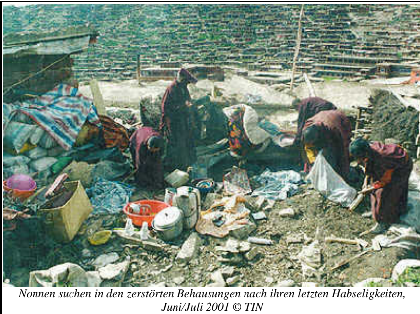
Nonnen suchen in den zerstörten Behausungen nach ihren letzten Habseligkeiten, Juni/Juli 2001

Die Studenten am Institut bauten ihre Unterkünfte selbst aus Lehmziegeln, Steinen und Holz und waren bezüglich Nahrung, Kleidung und anderen Dingen weitgehend Selbstversorger. Aufgrund der hohen Lage oberhalb der Baumgrenze mußten sie extreme Klimabedingungen aushalten, von eiskalten Wintern bis zu intensiver Sommerhitze.