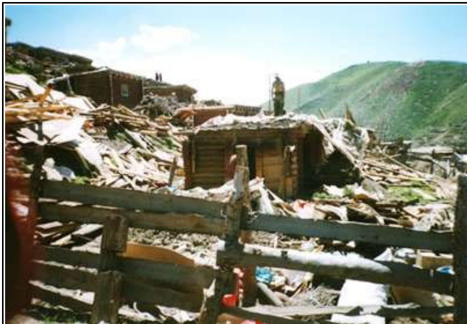
Abgerissene monastische Unterkünfte in Larung Gar

Am selben Tag leiteten zwei Distriktbeamte von der TAP Karze einen Befehl der Zentralregierung weiter, der Khenpo Jigme Phuntsoks Lehrplan und religiöse Zeremonien mit einem Verbot belegte. Khenpo befand sich zu der Zeit im dritten Monat eines siebenmonatigen Lehrzyklus. Dieser wurde am 24. Mai beendet, und von diesem Zeitpunkt an haben die Behörden alle größeren religiösen Zeremonien und andere öffentliche Ereignisse gestrichen. Für die im Institut verbliebenen Studenten sind Unterricht und Studium seither schwer beeinträchtigt.