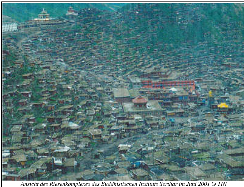
Ansicht des Riesenkomplexes des Buddhistischen Instituts Serthar im Juni 2001

Distrikts Serthar etabliert. Es versammelte die Studenten des Instituts zu Sitzungen politischer Indoktrinierung und verteilte Schriftstücke zur kommunistischen Ideologie.