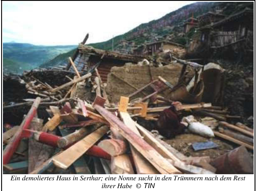
Ein demoliertes Haus in Serthar; eine Nonne sucht in den Trümmern nach dem Rest ihrer Habe