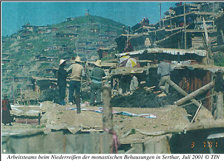
Arbeitssteams beim Niederreißen der monastischen Behausungen in Serthar, Juli 2001