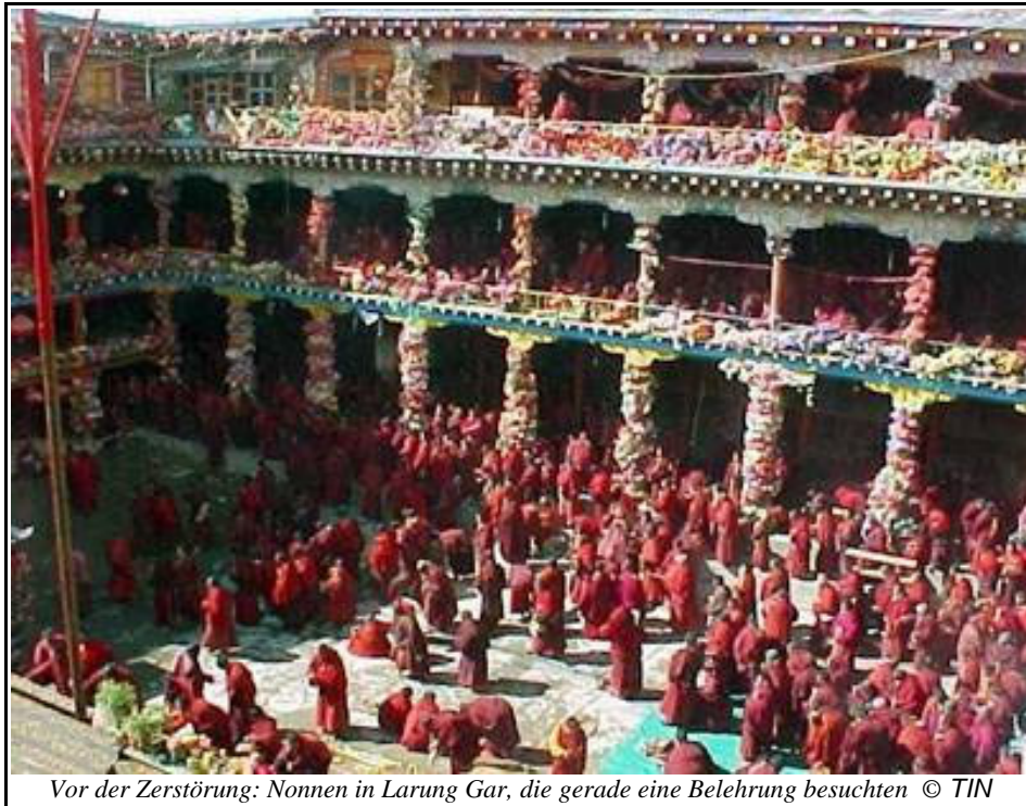
Vor der Zerstörung: Nonnen in Larung Gar, die gerade eine Belehrung besuchten