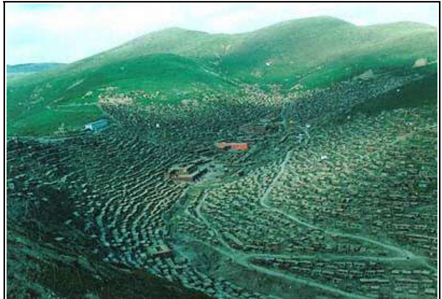
Der Komplex des buddhistischen Instituts Serthar vor der Zerstörung

Nach Aussage von Beobachtungsdiensten waren Ende Oktober mehr als 1.000 Wohnungen in Serthar zerstört worden, Tausende von Mönchen und Nonnen waren erfolgreich vertrieben worden, und man nimmt an, daß Khenpo Jigme Phuntsok in Chengdu, der Hauptstadt von Sichuan, in Isolationshaft ist. Der charismatische Gründer von Serthar war zuerst zum Zwecke medizinischer Behandlung in einem Militärhospital in Barkham, Tibetische Autonome Präfektur (TAP) Ngaba, aus seinem Institut abgeholt worden.