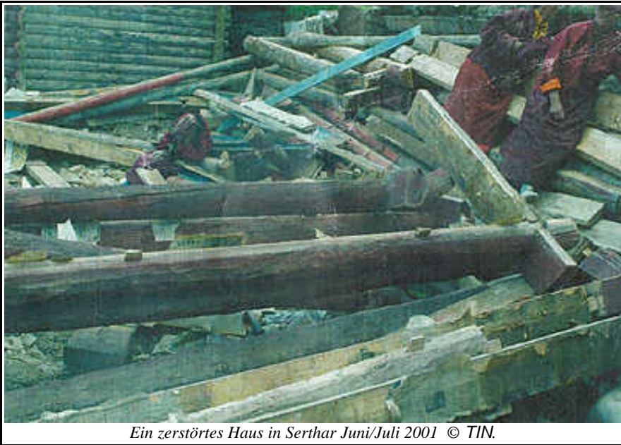
Ein zerstörtes Haus in Serthar Juni/Juli 2001 © TIN.

Verschiedene Berichte von Beobachtungsorganisationen weisen darauf hin, daß der Oktober 2001 von den Behörden als letzter Termin für die Umsetzung der Verfügung vom April festgesetzt war. Die